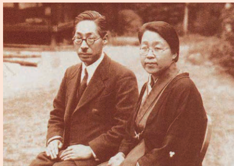
(香川栄養学園創立者 香川昇三・綾)